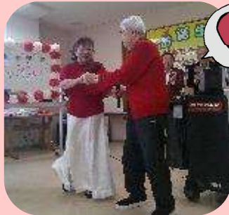
ボランティアさんと一緒に ダンスをしました