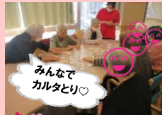
みんなで カルタとり♡